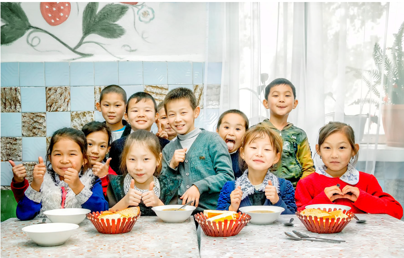
Foto da capa - Crédito da foto Emilio Monzon para CRS Guatemala, enviada por Emily Drummer

Representantes governamentais, revisores da pesquisa, pesquisadores, doadores e outras partes interessadas em todo o mundo compartilharam um feedback incrivelmente positivo sobre a Pesquisa Global de Programas de Alimentação Escolar, enaltecendo-a como um recurso extraordinariamente único e valioso cujo valor continuará a crescer ao longo do tempo. Devemos, portanto, manter o rumo!