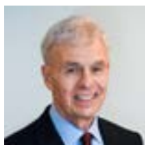
Доктор Рональд Клейнман Президент Совета

Мы благодарны, что вы осознаете важность Глобального опроса и нашли время в своем плотном графике, чтобы его заполнить. Ваш вклад поможет документировать и сформировать базу данных программ школьного питания как на национальном, так и на глобальном уровнях; оценить негативное влияние различных чрезвычайных ситуаций на школьное питание; и продемонстрировать устойчивость и креативность программ школьного питания перед лицом вызовов. Мы надеемся, что данные опроса будут полезны для понимания и продвижения школьного питания в вашей стране, а также они смогут поддержать политику и решения, основанные на корректных данных.